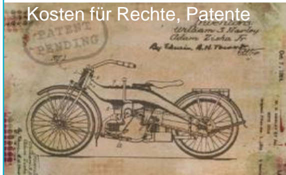
Kosten für Rechte, Patente